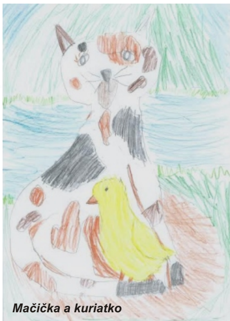
Mačička a kuriatko