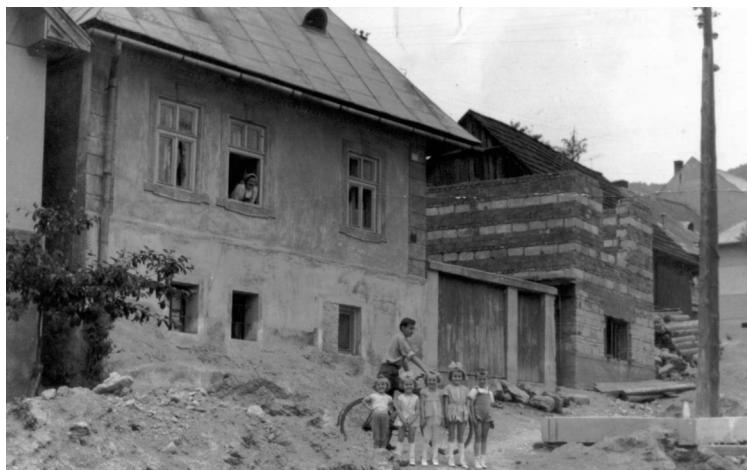
Na Grante (rok 1962)