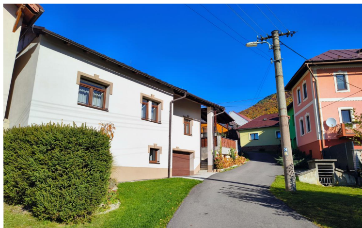
Na Grante (rok 2026)