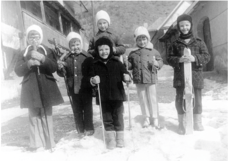
Deti pod gangom starej školy nachystané na lyžovačku (rok 1976)

V redakcii Podkonického spravodaja sa budeme aj naďalej tešiť vašim fotkám z minulosti. Môžete sa s nimi zastaviť na obecnom úrade alebo nám ich pošlite zoskenované, prípadne odfotené na mail redakcie: podkonicky.spravodaj@gmail.com. Ďakujeme.