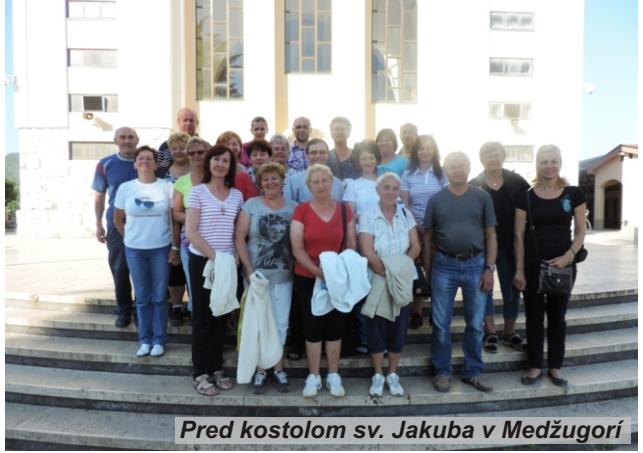
Pred kostolom sv. Jakuba v Medžugorí

► Vďaka CK Awertravel sme si okrem krásneho duchovného programu mohli občerstviť aj svoje telá kúpaním sa v kryštáľovo čistom mori na Makarskej (cestou tam) a potešiť svoje oko pohľadom na nádherné vodopády a jazerá národného parku Plitvické jazerá (cestou späť).