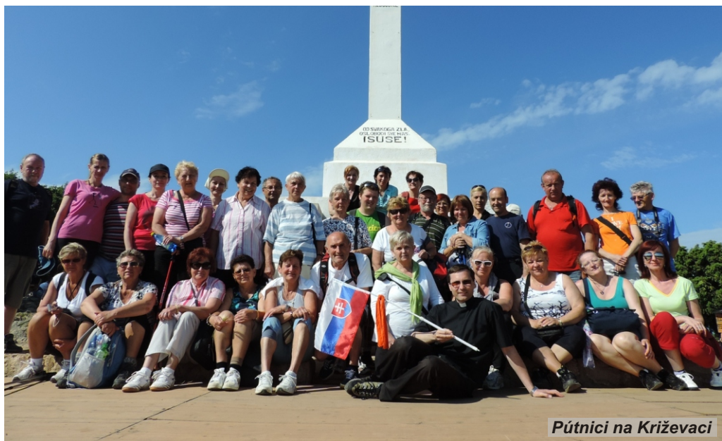
Pútnici na Križevaci

► Počas troch celých dní, ktoré sme v Medžugorí strávili, sme boli účastní na sv. omšiach, večerných modlitbových programoch, t.j. modlitby sv. ruženca, požehnanie náboženských predmetov, modlitby za uzdravenie tela i duše, adorácia pred najsvätejšou Sviatosťou Oltárnou. Večerné sväté omše sa kvôli veľkému počtu pútnikov konajú mimo Kostola sv. Jakuba apoštola (patróna pútnikov) pri tzv. vonkajšom oltári za kostolom s 5 tisícami miest na sedenie. Ráno sme mávali sv. omšu pre slovenských pútnikov v kaplnke a večerná medzinárodná sv. omša v chorvátskom jazyku bola s možnosťou simultánneho prekladu do slovenčiny. Hovorí sa, že Medžugorie je spovednicou sveta, za deň sa tu vyspovedá aj 10 tisíc ľudí. Za pozornosť stojí miesto na konci zastavení tajomstiev ruženca svetla, kde sa nachádza bronzovo-medená socha, ktorá má názov „Vzkriesený Kristus“. Skladá sa z dvoch častí - vodorovného kríža a ukrižovaného tela Ježiša Krista. Z jeho pravého lýtka nevysvetliteľne vyteká tekutina, ktorá sa považuje za liečivú.