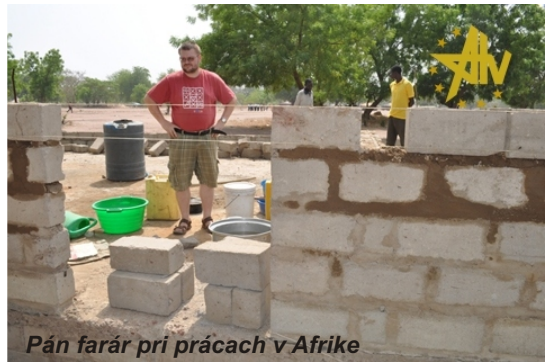
Pán farár pri prácach v Afrike