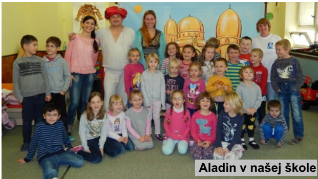
Aladin v našej škole

V tomto mesiaci 19. 11. nás navštívilo aj profesionálne divadlo s názvom „Divadlo bez opony“ a rozprávkou Aladin nás zaviedli do ďalekého orientu. Úžasné herecké výkony, dialógy pretkávané rýmami a vtipnými momentami dostali nielen deti, ale aj nás dospelých. Zasmiali sme sa do sýtosti a dohodli sme sa, že určite u nás neboli prvý a posledný krát. Naozaj úžasný umelecký zážitok.