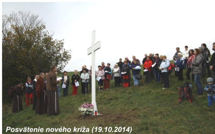
Posvätenie nového kríža (19.10.2014)