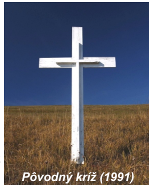
Pôvodný kríž (1991)