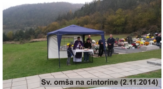
Sv. omša na cintoríne (2.11.2014)

Prejdeme popri hrobch, najmä na staršom cintoríne, kde už nežijú potomkovia. Pozriem na meno, ak tam vôbec nejaké je. Z mnohých hrobov je už len kôpka zeme a nebudaj zvalený drevený kríž. Na jednom hrobe pri chodníku ma zaujal nápis: „Smrťou život nekončí, ale smrťou niekoho sa život mení.“ Odišli ste do nenávratna a my už len modlitbou zmierňujeme svoj žiaľ. Tá modlitba vŕucne zabliká v podobe vďačnej chryzantémy. Určitá nostalgia zostáva v nás cestou domov, slzy dojatia, úprimný pohľad na priestor cintorína. A ešte povedzme posledné v tento deň: „Odpočívajte všetci v pokoji!“