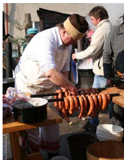
viac fotografií najdete na: www.podkonice.sk www.podkonican.dphoto.com