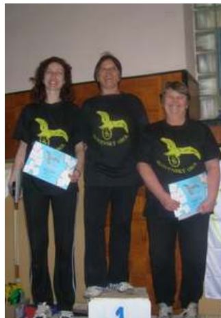
Ženy - 2.skupina