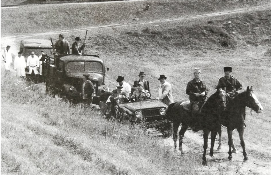
Z histórie Turistického prechodu Donovaly - Kalište - Podkonice

Zalovte vo svojich škatuliach a posielajte na mail jankasipka@pobox.sk , spravodaj@podkonice.sk alebo tí z vás, ktorí nemajú možnosť skenovať, zastavte sa u mňa doma a rada vám s tým pomôžem.