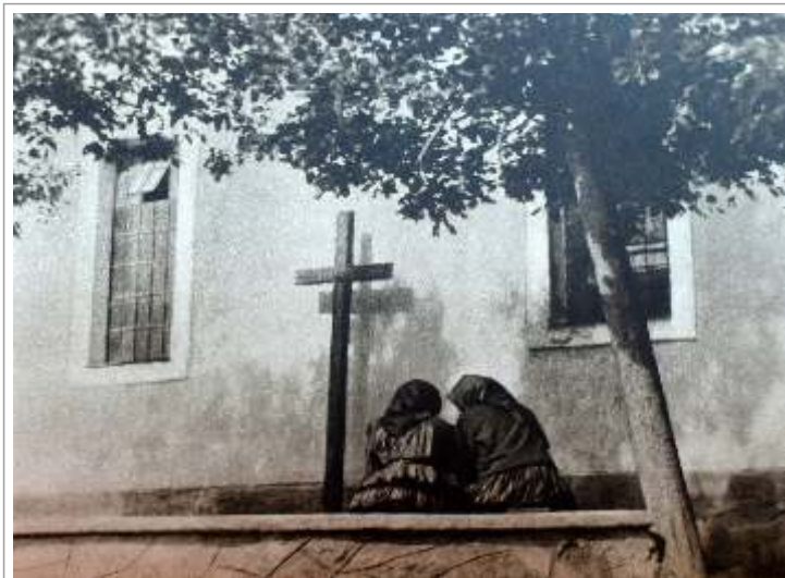
Starenky pred kostolom