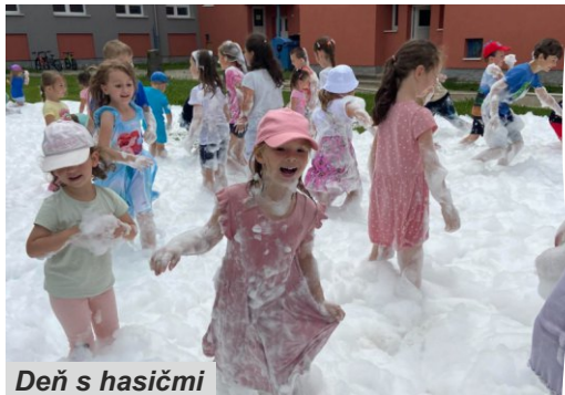
Deň s hasičmi

Deti zo škôlky si pre hasičov pripravili poďakovanie vo forme plagátu, ktorý v škôlke spoločne vyrobili a naši školáci im osobne upiekli tortu. Ďakujeme dobrovoľným hasičom za ich čas, energiu a interaktívnu prednášku plnú zážitkov a prekvapení.