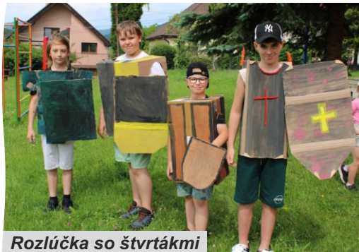
Rozlúčka so štvrtákmi

Mesiac jún je posledným mesiacom školského roka a po ňom nasledujú vytúžené dvojmesačné prázdniny. Pre našich štvrtákov, to bol posledný školský rok tu u nás v Podkoniciach a každým pribúdajúcim dňom a blížiacimi sa prázdninami bolo cítiť, že prichádza nostalgia. Ešte pred tým, ako sme ich z našej školy vypravovali, sme im zorganizovali rozlúčku . Štvrtáci sa na chvíľu premenili na mušketerov a museli preukázať svoju silu, vytrvalosť, bojovnosť a spolupatričnosť. Svojim vlastnoručným podpisom potvrdili, že aj v novej škole budú dodržiavať rytierske desatoro, ktoré sme sa im snažili počas celých štyroch rokov vstúpať. Po zdolaní rôznych disciplín sme našich štyroch mušketerov symbolicky vypravovali na odchod do ďalšieho väčšieho "kráľovstva", kde im prajeme veľa úspechov a nových zážitkov. Nelúčili sme sa len v škole, ale rozlúčkovú párty mali aj v škôlke. Pani učiteľky si na rozlúčku s predškôlkami pripravili rôzne úlohy, v ktorých si predškôláci preverili vedomosti aj pohybovú zdatnosť a po zdolaní všetkých úloh našli poklad, v ktorom sa ukrývali odznaky pre budúcich prváčikov. Predškôláci už tento rok ukončia svoju škôlkariku misiu a nastúpia do školského vlaku, ktorý ich prevedie všetkými písmenami a číslami. Nástupná stanica ZŠ Podkonice, september 2024.