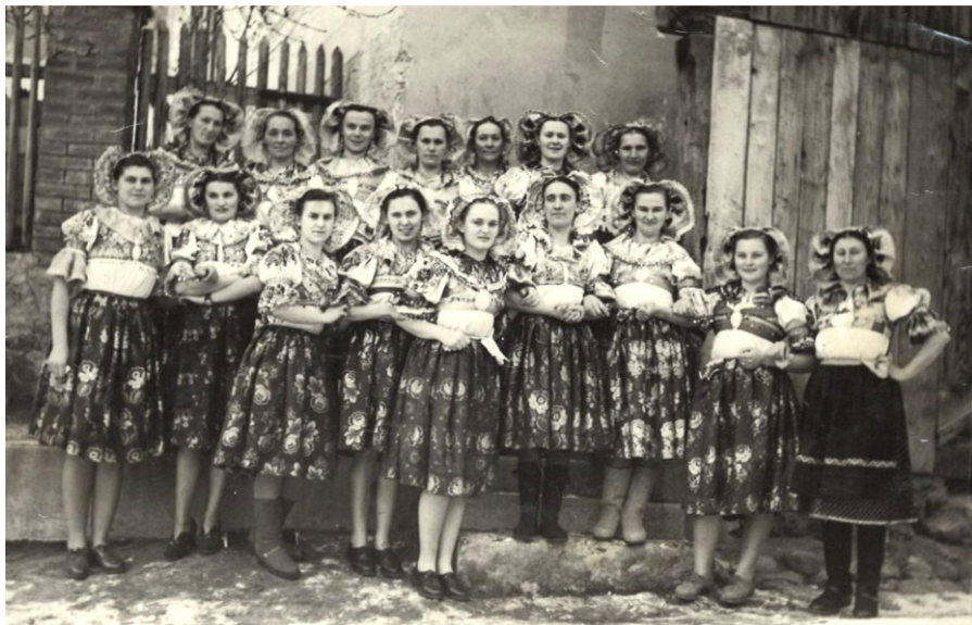
Podkonické ženy - fotené v roku 1953

V redakcii Podkonického spravodaja sa budeme aj naďalej tešiť vašim fotkám z minulosti. Môžete sa s nimi zastaviť na obecnom úrade alebo nám ich pošlite zoskenované, prípadne odfotené na mail redakcie: podkonicky.spravodaj@gmail.com. Ďakujeme.