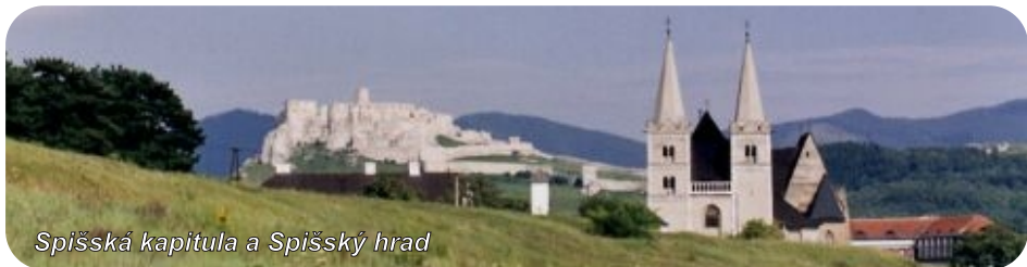
Spišská kapitula a Spišský hrad

Štvrtá zastávka bol Chrám Navštívenia Panny Márie na Mariánskej hore , v ktorom naši duchovní otcovia odslúžili svätú omšu len pre nás. V tichu krásneho chrámu na posvätnom mieste sme načerpali veľa duchovnej sily a uvedomili si silu veľkej lásky a dobroty Panny Márie, našej ochrany. Z Mariánskej hory sa nám naskytol prekrásny pohľad na celý Spiš. Takto duševne a telesne obcerstvení sme nasadli do autobusu na cestu do poslednej zastávky tohto dňa, ktorou bola Spišská Kapitula , sídlo spišského diecézneho biskupa. V areáli je kňazský seminár a v jednej z jeho častí sme boli ubytovaní. V seminári nás prijali ako pravých pútnikov, poskytli nám ubytovanie, večeru a raňajky. Po večeri sme mali individuálny program, ktorý sme využili na prechádzku po areáli a kochali sme sa ►