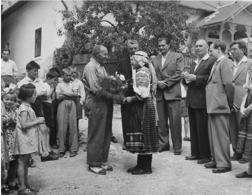
Návšteva akademického maliara Martina Benku v Podkoniciach (rok 1956)

V redakcii Podkonického spravodaja sa budeme aj naďalej tešiť vašim fotkám z minulosti. Môžete sa s nimi zastaviť na obecnom úrade alebo nám ich pošlite zoskenované, prípadne odfotené na mail redakcie: podkonicky.spravodaj@gmail.com . Ďakujeme.