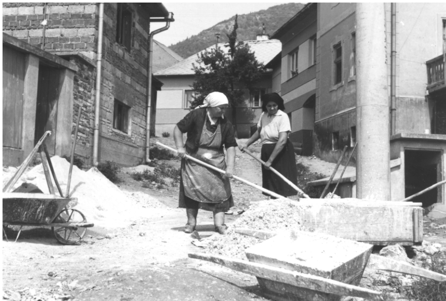
Ženy pomáhajú pri stavebných prácach na Grante

V redakcii Podkonického spravodaja sa budeme aj naďalej tešiť vašim fotkám z minulosti. Môžete sa s nimi zastaviť na obecnom úrade alebo nám ich pošlite zoskenované, prípadne odfotené na mail redakcie: podkonicky.spravodaj@gmail.com. Ďakujeme.