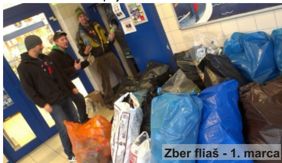
Zber fliaš - 1. marca

15.3. v sobotu sme opäť zbierali PET fľaše po dedine pre akciu v Lidli. Spolu sme nazbierali 3714 fliaš a umiestnili sme sa na 301. mieste. Ďakujem rodičom, bývalým žiakom a priateľom školy, ktorí sa do akcie zapojili