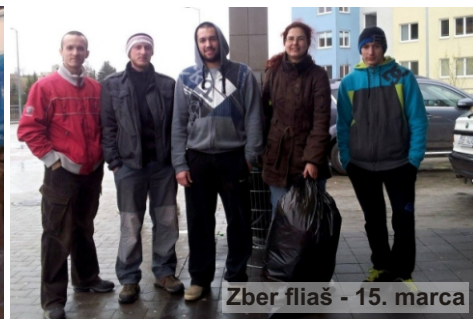
Zber fliaš - 15. marca

26.3. - sme boli v múzeu v Thurzovom dome na tvorivých dielňach s témou „Medovníkari“