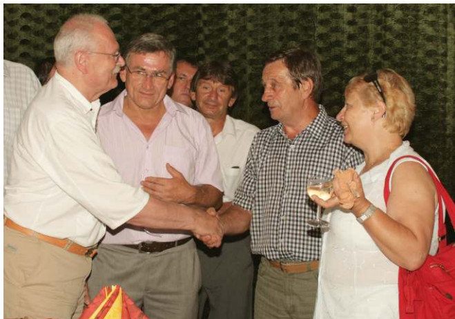
Korytárky - 17. júla 2010