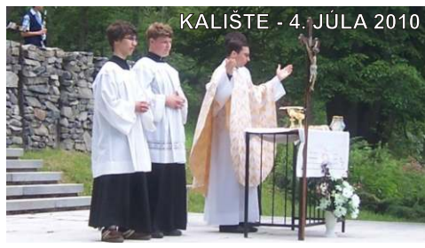
KALIŠTE - 4. JÚLA 2010