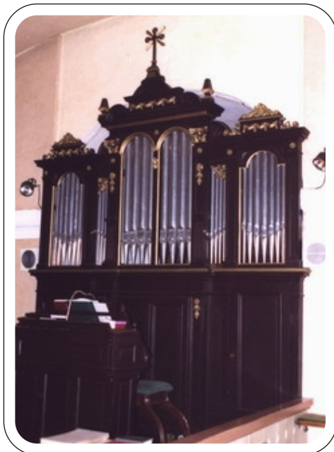
Foto: Portál podkonického organu po generálnej oprave v roku 1992