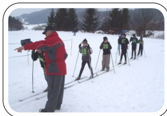
Mladší žiaci - príprava na štart